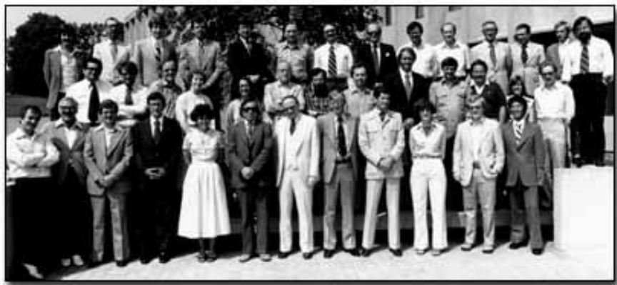
Os participantes do seminário do API em 1978

De acordo com informações disponíveis em seu site na Internet, a organização é classificada como “uma aliança de negócios em que os membros se reúnem para