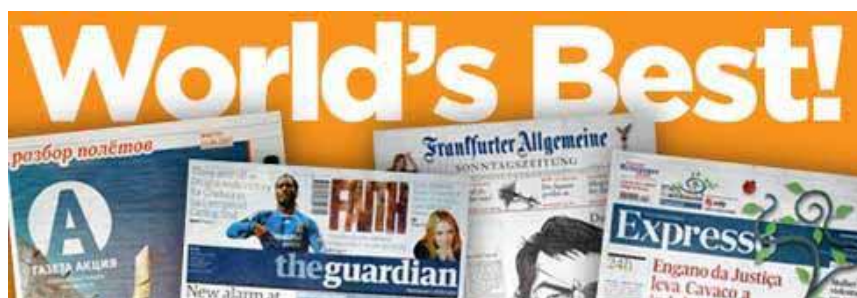
Os grandes premiados da 29ª edição

Dos 33 países premiados, com um total de 193 jornais, os Esta-