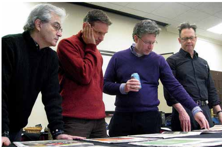
Os juízes da 29ª edição escolhendo os melhores do mundo