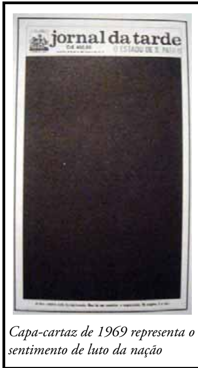
Capa-cartaz de 1969 representa o sentimento de luto da nação

Em 4 de janeiro de 1966, o Jornal da Tarde começou a circular na cidade de São Paulo. Com o propósito de chegar às bancas após ao meio dia, ele se destacou por não mais oferecer um resumo dos fatos ocorridos no dia anterior, mas sim fazer críticas e pensar sobre eles. Com isso, ele apostou seu projeto no New Journalism, de Gay Talese e Truman Capote, uma escola que surgiu nos Estados Unidos e que se caracteriza principalmente por unir jornalismo e literatura.