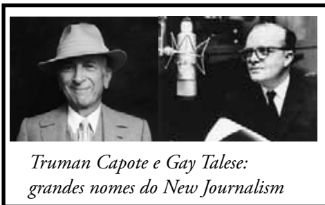
Truman Capote e Gay Talese: grandes nomes do New Journalism

No começo dos anos 1980, começa uma nova fase no Jornal da Tarde. Começam a ser publicados os suplementos Seu Dinheiro, sobre finanças pessoais, e Jornal do Carro, sobre veículos, cuja tabela de preços tornou-se referência no mercado. O Jornal do