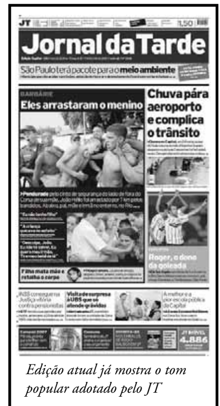
Edição atual já mostra o tom popular adotado pelo JT