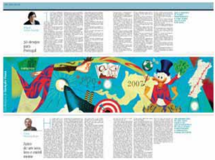
■ Prêmio máximo para o Expresso, de Portugal

A SND e suas associadas promovem competição anual entre os jornais de todos o mundo.