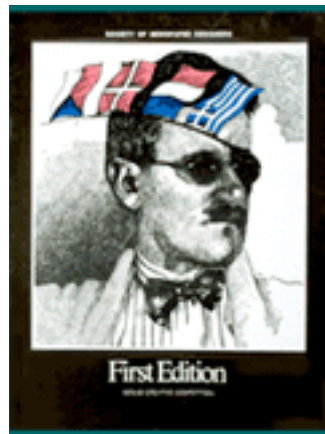
■ Primeira edição do The Best of Newspaper Design , em 1980

Nem todos os pensadores consideram as imagens tão maléficas na sociedade contemporânea quanto Baudrillard. Arlindo Machado acredita que “serão necessárias muitas décadas de desenvolvimento dos meios audiovisuais para que o discurso das imagens