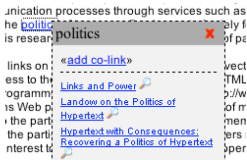
Figura 1: menu de co-links